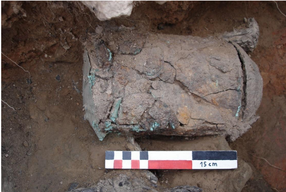
Detall de la urna.