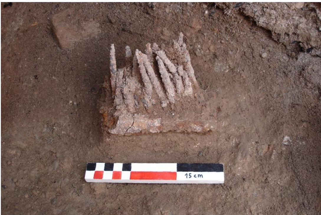
Cardador aparegut de manera individual corresponent a la UE 8530.