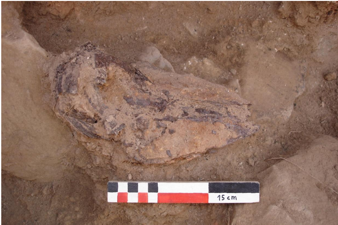
Tisores de xollar un cop excavades, s'aprecia el mal estat de conservació.