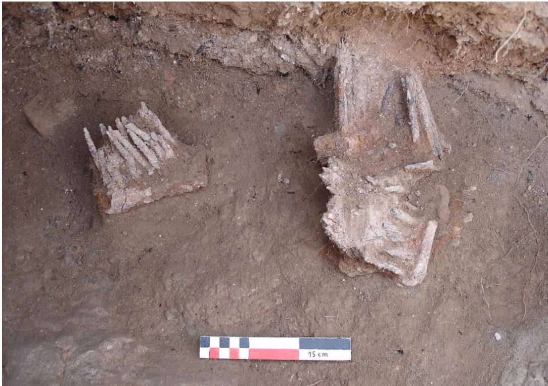
Podem veure el cardador aparegut individualment al costat del conjunt de 4 cardadors (UE 8530, 8532, 8533, 8534 i 8535).