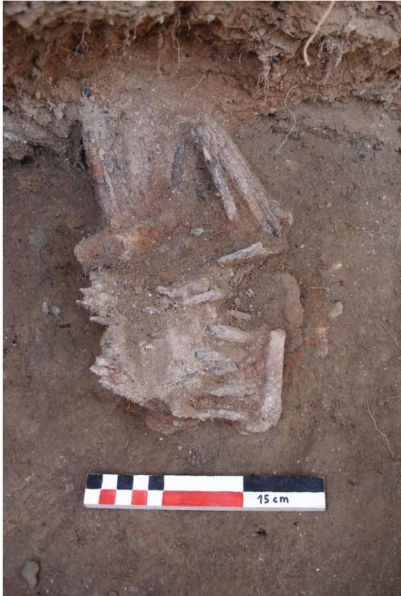
Conjunt de quatre cardadors (UE 8532, 8533, 8534 i 8535) apareguts al costat del que hem vist en la fotografia anterior (UE 8530).